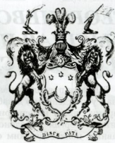
Экслибрис адмирала М.П. Лазарева