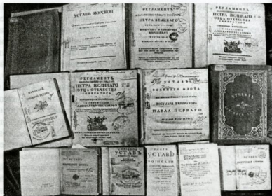
Раритеты Севастопольской Морской библиотеки

сделал взнос 300 руб. серебром. В июле средства были собраны, и комитет директоров вышел с ходатайством к начальнику штаба заказать бюст М.П. Лазарева в Одессе «лучшему ваятелю из лучшего мрамора и установить его в библиотеке – любимом детище адмирала...» [6, с.189]. Бюст был изготовлен и установлен в газетной комнате библиотеки.