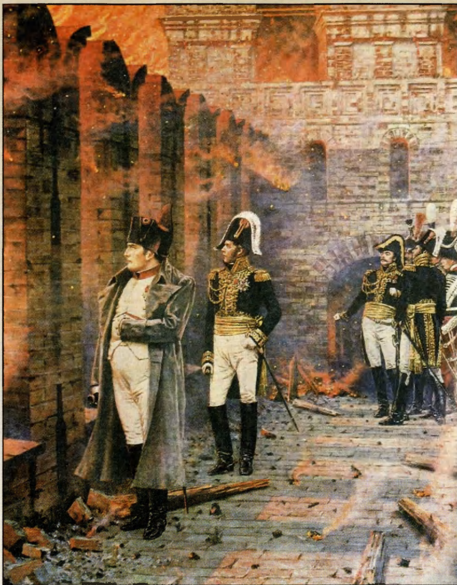
«В Кремле — пожар!»

После Берлина в выставках пришлось сделать перерыв — наступал сезон летних каникул, и вся Европа устремилась на отдых к морю. Весну 1897 года Верещагин проводит с семьей в окрестностях Севастополя у Георгиевского монастыря, а затем, отправив домочадцев в Нижние Котлы, перебирается на Кавказ. Но уже 30 июля он в Москве, чем немало удивил Павла Михайлови-