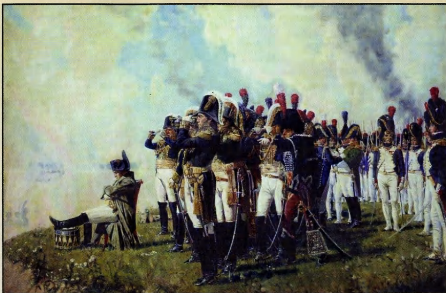
«Наполеон на Бородинских высотах». 1897 г.

Монография «В.В. Верещагин» все же появилась на свет. Российский журнал «Исторический вестник» откликнулся на нее статьей В.С. Росоловского «В.В. Верещагин и его произведения». Обозреватель в частности отмечал: «Нельзя указать на другого художника, который бы так много говорил, писал и печатал о самом себе, как В.В. Верещагин, страдающий субъективностью и сводящий значение всех собратий к нулю». Реакция живо-