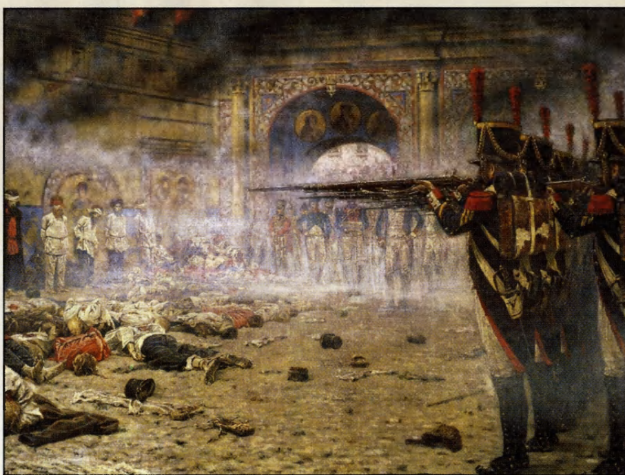
В покоренной Москве («Поджигатели» или «Расстрел в Кремле»). 1897-1898 гг.