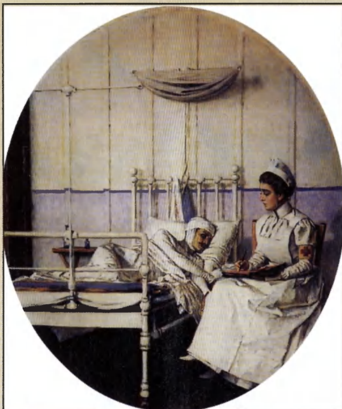
«Письмо на родину» («Письмо к матери»), 1901 г.