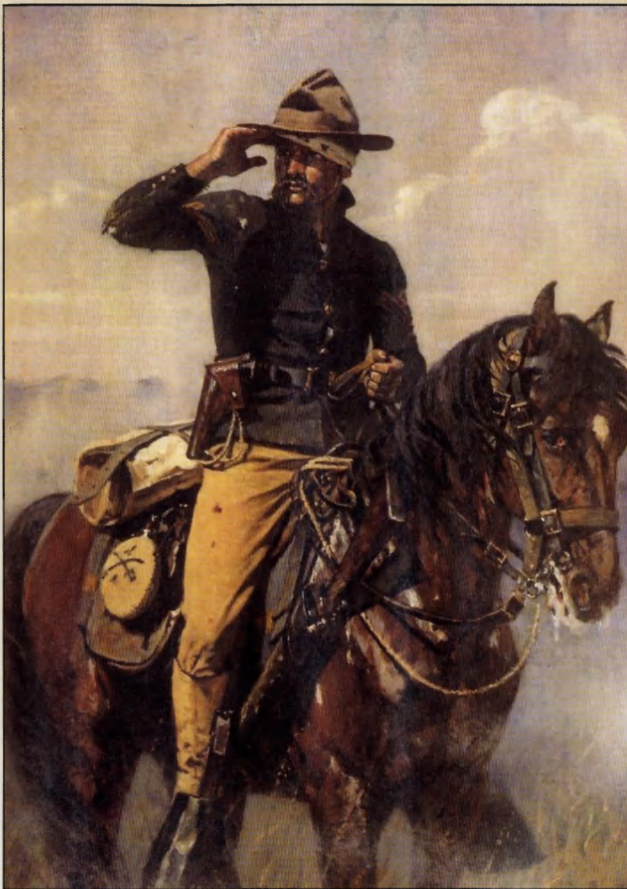
«Раненый», 1901 г.

В Сингапуре Верещагин покидает борт «Саратова». Пароход следует в Нагасаки и далее в Порт-Артур, а он оформляет документы для посещения Филиппин и ближайшим рейсом на немецком пароходе отправляется в Манилу. Время в Сингапуре Василий Васильевич использовал рачительно. Например, выяснил каковы там позиции русской торговли. Они оказались далеко не лучшими. В основном торговали русскими папиросами и паюсной икрой. А ведь только «...одна соседняя Манила, — отмечает он, — с массой американского военного элемента, ее наполняющего, поглотит сколько угодно... русского добра, умело выбранного и доставленного».