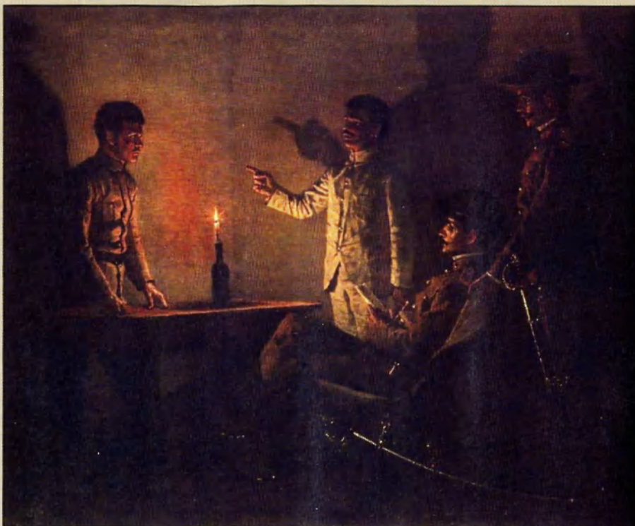
«Допрос перебежчика», 1901 г.

Американцы тоже приняли участие в схватке. Два человека из штаба Агинальдо были ранены, но скрылись, а казначей революционного правительства сдался. Остальные филиппинские офицеры бежали. Агинальдо с покорностью принял плен, сильно опасаясь, однако, мести макабебов. Но генерал Фанстон заверил его, что он может чувствовать себя в безопасности. Это успокоило Агинальдо, и он согласился разговаривать. Он был чрезвычайно удручен тем, что попал в плен, и заявил, что ни при каких других обстоятельствах его не взяли бы живым. Эти слова придают еще больше значения подвигу Фанстона: борьба с Агинальдо была