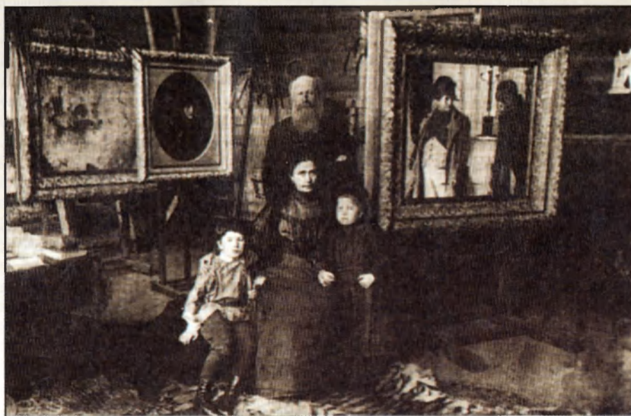
Василий Верещагин в кругу семьи

В конце 80-х годов германский флаг взвился над островами архипелага Бисмарка, расположенного к северо-востоку от Австралии, а Страну Восходящего Солнца наводнили германские военные инструкторы, юридические и экономические советники, активно насаждавшие «пруссский» дух в японские вооруженные силы, законы, торговые кодексы, образование. Однако успех германского милитаризма на японских островах оказался кратковременным. Поставив 10 мая 1895 года свою подпись под ультиматумом о возвращении Японией Ляодунского полуострова Китаю, Берлин надеялся заручиться поддержкой России и Франции в установлении своего владычества на Тайване и в приобретении Филиппин у несговорчивого испанского двора. Однако ни