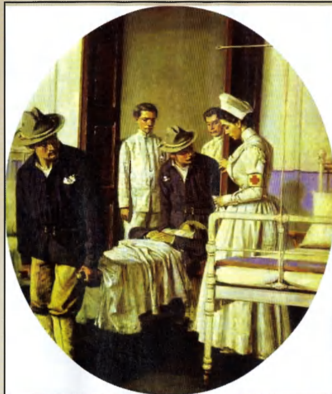
«В госпитале», 1901 г.

В это же время бурно развивающиеся Соединенные Штаты Америки активно вытесняли слабеющую Испанию из бассейнов Карибского и Южно-Китайского морей. После загадочного взрыва американского броненосца «Мэн» (об этом читайте в НИТ 6, 2011 г.) 15 февраля 1898 года в Гаванском порту американцы начали полномасштабные действия. Конгресс принял резолюцию с требованием к Испании незамедлительно освободить Кубу, передав ее на попечительство США, Министерство иностранных дел разорвало дипломатические отношения с Мадридом, американские средства массовой информации развернули шумную кампанию против «испанских жестокостей на Кубе». В стране начался призыв в армию волонтеров и боевое развертывание флота. С 21 апреля корабли ВМС США приступили к захва-