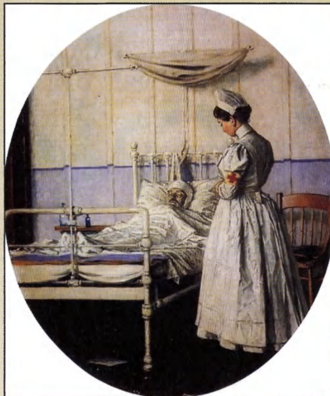
«Письмо осталось неоконченным», 1901 г.

обличительного пафоса прежних военных полотен Верещагина» и, добавив от себя, по своему содержанию не способствовали пониманию глубинного смысла наполеоновских полотен. Ясно одно: мы никогда не узнаем всей правды об этой странной поездке, но попытаться приподнять завесу тайны должны, с тем, чтобы лучше понять внутренний мир художника.