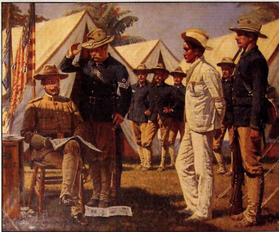
«Шпион», 1901 г.