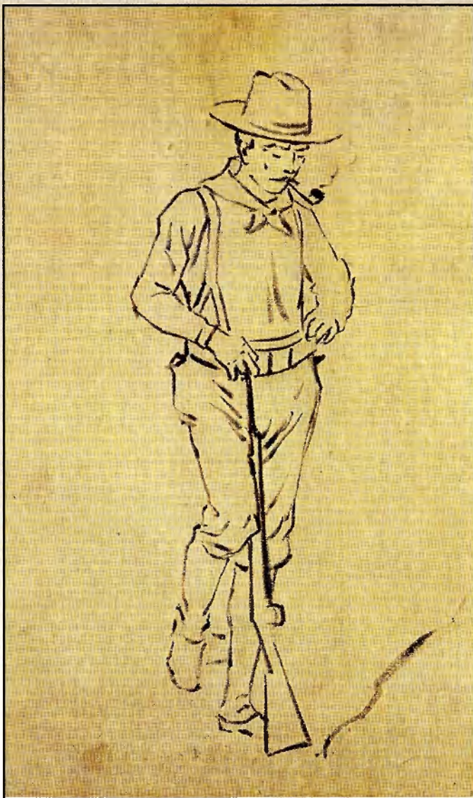
Солдат американской армии. 1901 г.

алчных аукционистов внезапным извещением о снятии с продаж наполеоновской серии «1812 год». Дело в том, что накануне последнего дня аукциона из Петербурга пришло сообщение о приобретении царским правительством всех двадцати картин за 100 000 рублей, для Русского музея имени Александра III. Известие пришло как нельзя кстати. Еще перед началом торгов журналисты обратили внимание на небольшую группу спекулянтов, внимательно изучавших и обсуждавших картины. Они договаривались искусственно сбить цены, с тем, чтобы после покупки шедевров с большой выгодой перепродать «тугим на подъем здешним дирекциям картинных галерей и музеев», а то и возвратить их в Старый Свет, например, тому же русскому правительству.