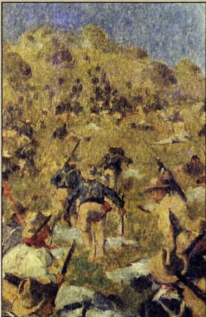
Взятие Рузвельтом Сен-Жуанских высот. Эскиз. 1902 г.