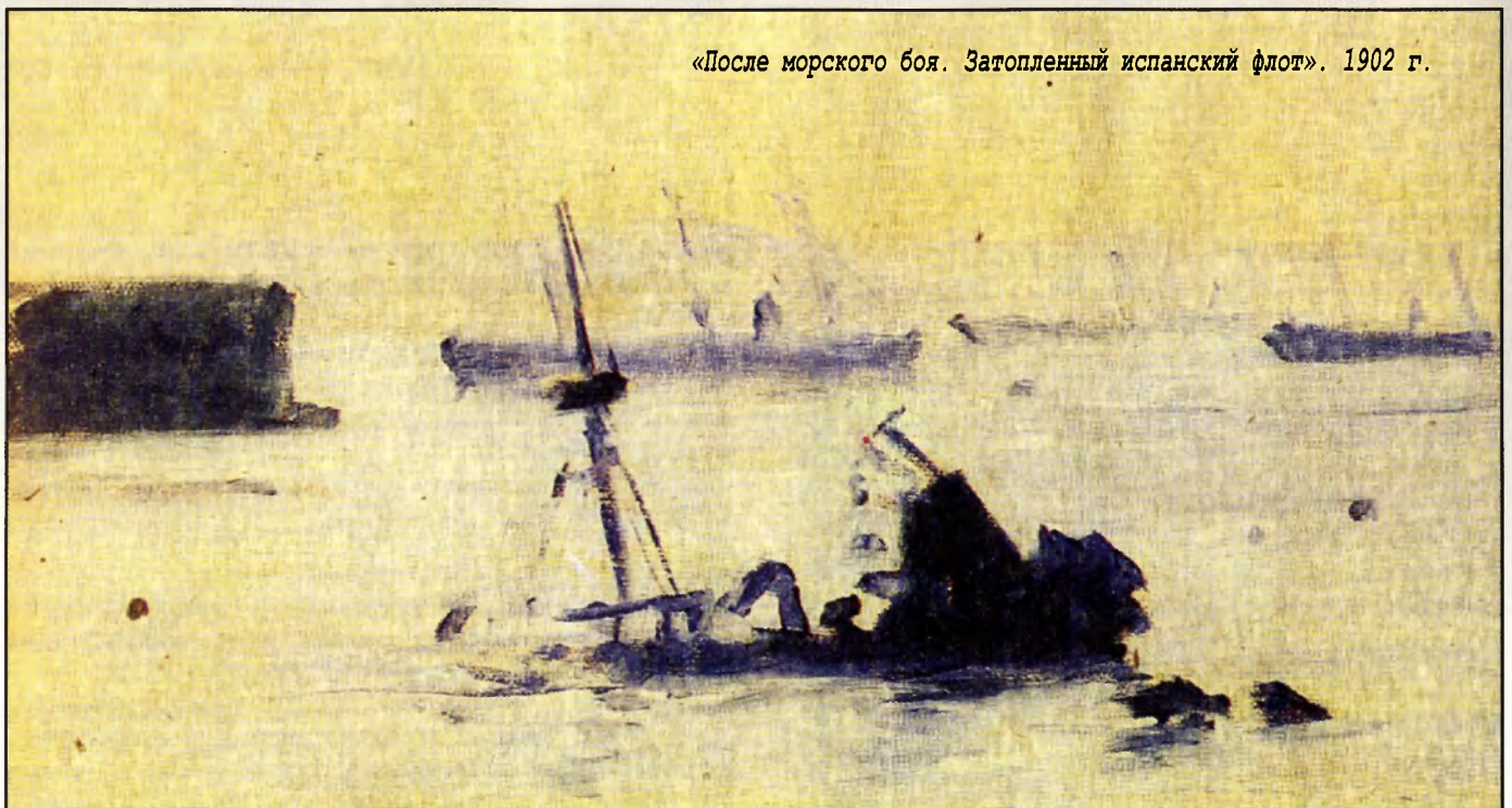
«После морского боя. Затопленный испанский флот». 1902 г.