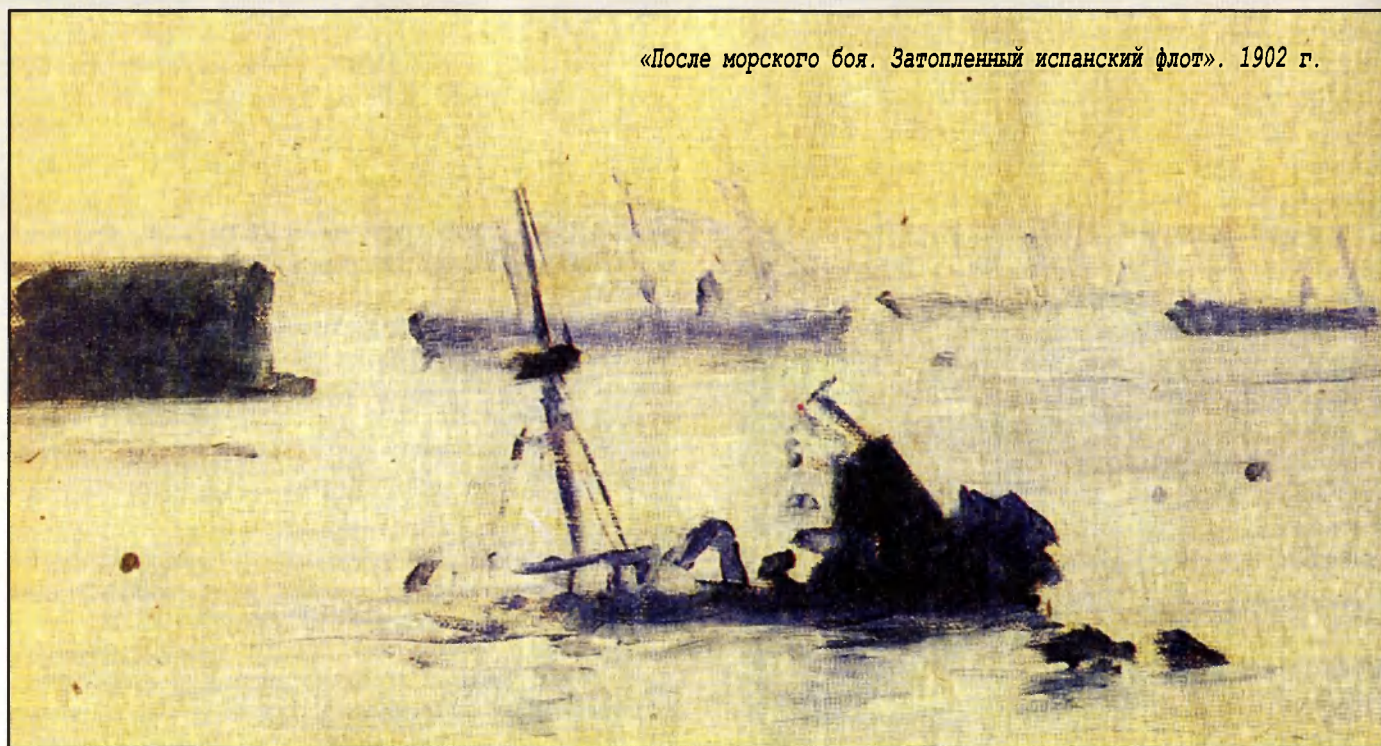
«После морского боя. Затопленный испанский флот». 1902 г.