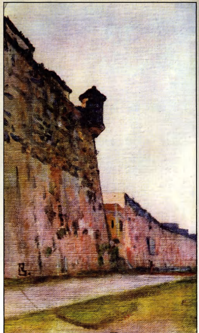
Крепость Сант-Яго. 1902 г.

В обширной литературе, посвященной жизни и творчеству Верещагина, Куба обычно упоминается вскользь. Долгое время даже не было известно: сколько же раз посещал Верещагин Кубу, где побывал и с кем встречался. Во многом это объ-