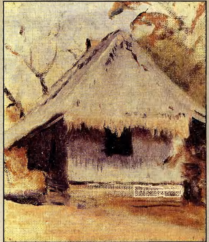
Жилище островитян. Этюд. 1901 г.

В целом, по сообщению Мак-Гахан, аукцион принес Верещагину 43070 долларов (около 87 тысяч рублей), но разочаровал