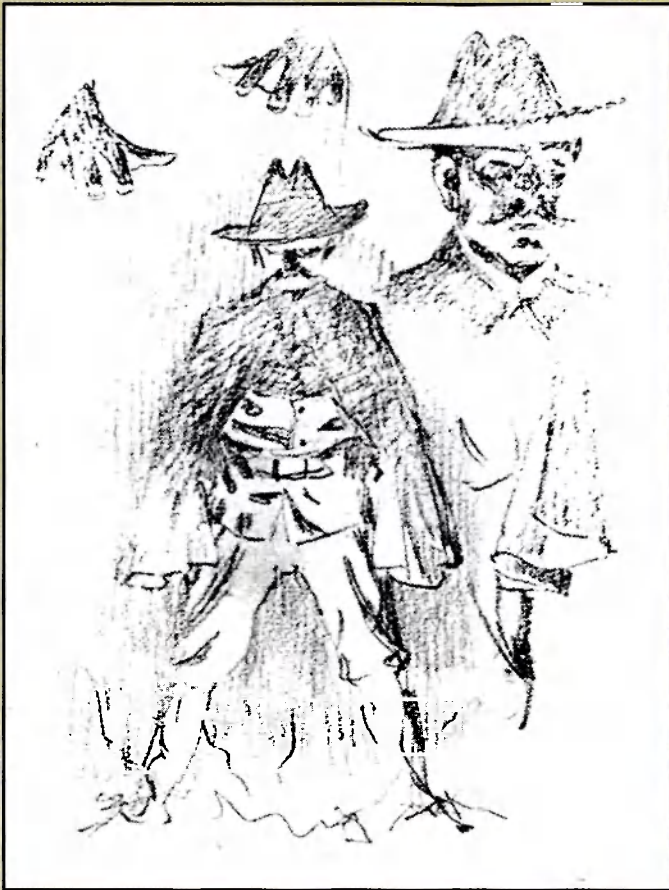
Мужская фигура в плаще, освещенная снизу. 1902 г.

В ответном письме (19 октября 1902 года) из Петербурга Владимир Васильевич уведомляет, что с удовольствием исполнит просьбу, но просит сообщить: где сейчас находится Василий Васильевич? Когда планирует вернуться в Россию? Думает ли устроить по возвращении выставку? Знает ли о «венском адресе» и не будет ли возражать против его публикации?