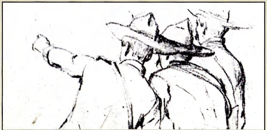
Группа из трех американских солдат, смотрящих вдаль (набросок)