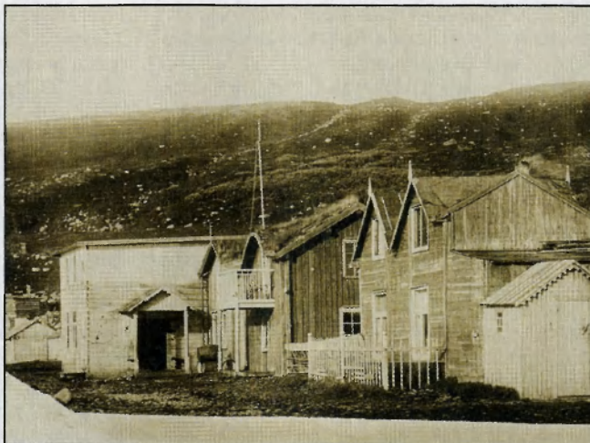
Постройки Эриксона на Кильдине.

Взяв всё лучшее из проектов Амона и Правительственной комиссии 1872 года, учтя опыт преуспевающих колонистов Эриксонов, Сосновский разработал план образцовой колонии, в котором максимально учёл интересы нынешних и будущих поселенцев. Не упустил из виду губернатор и санитарно-экологическую безопасность будущего города-порта: «...в предотвращении антисанитарной и