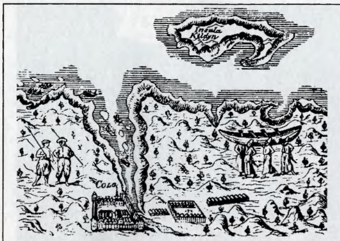
Карта Мурмана. XVIII век.

из воды у входа в Кольский залив камень-остров Кильдин. Справедливости ради замечу, что остров был здесь и до 1533 года.