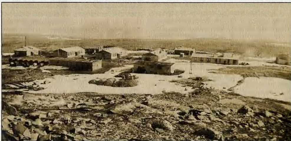
Военный городок ракетчиков, 1960-е годы.

Гранитный «крейсер Кильдин», как тогда называли остров, находился в оперативном резерве командования Мурманского укрепрайона и Штаба Северного флота и за всю войну так и не произвёл ни единого выстрела по врагу. Даже в трагическую ночь с 9 на 10 августа